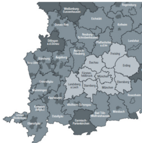
Landkreis / kreisfreie Stadt EFRE-Schwerpunktgebiet (Raum mit besonderem Handlungsbedarf gemäß LEP, Stand: 1. März 2018), mindestens 60 % der EFRE-Mittel Sonstiges EFRE-Fördergebiet EFRE-Fördergebiet nur für den Förderbereich 2 (Klima- und Umweltschutz)

Um eine gleichmäßigere Entwicklung der Elektromobilität im Alpenraum zu gewährleisten, unterstützt das Projekt e-Moticon öffentliche Verwaltungen in der Alpenregion dabei, die Verbreitung von Stromtankstellen für Elektrofahrzeuge sowie ihre Interoperabilität beim öffentlichen Zugang zu diesen Ladesäulen zu verbessern.